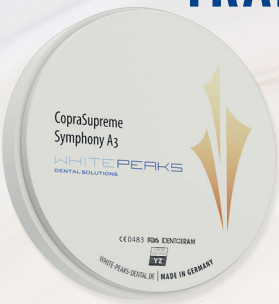
CupraSupreme Symphony 16 VITA classic shades multilayer (A1 - D4)