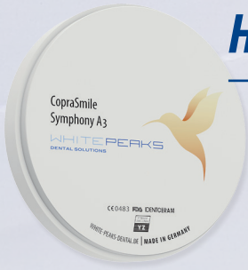
CupraSmile Symphony 16 VITA classic shades multilayer (A1 - D4)